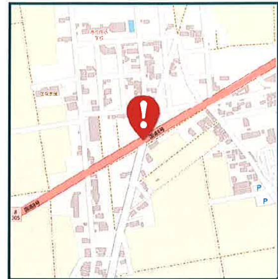
津波倉町ホ4 付近 追突注意！